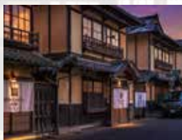
NIPPONIA HOTEL 大洲城下町