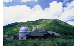
星の山荘梶ヶ森と山頂方面(イメージ)