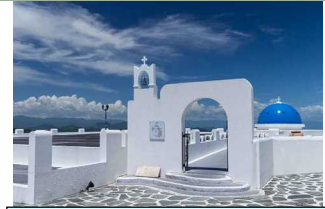
ヴィラ サントリーニ 外観(イメージ)